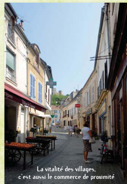
La vitalité des villages, c'est aussi le commerce de proximité