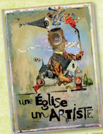
Lors des Journées du patrimoine de 2008, des artistes locaux ont investi les églises avec une œuvre créée à cette occasion.

Du Hurepoix à l'ouest de l'ancestrale forêt d'Yveline, l'Histoire de France a laissé des traces sur le territoire du Parc : de grands édifices mais également un tissu remarquable de bâtis ruraux qui font le charme de ses paysages façonnés par les modes de vie ruraux.