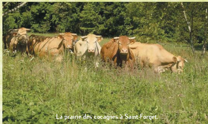
La prairie des cocagnes à Saint-Forget.

Satisfaire ces 4 grandes ambitions est un défi. Il peut être relevé grâce à la mobilisation de tous, habitants, élus, associations, entreprises, ...et la synergie et l'exemplarité dans les actions menées.