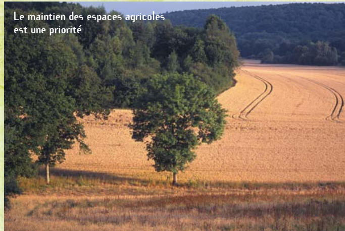
Le maintien des espaces agricoles est une priorité