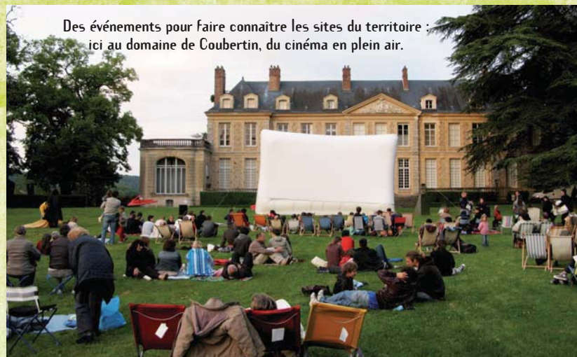
Des événements pour faire connaître les sites du territoire : ici au domaine de Coubertin, du cinéma en plein air.

▲ « Cette journée de formation m'a apporté une multitude de détails techniques concrets pour la mise en œuvre sur chantiers de procédés beaucoup plus efficaces, confie l'un des artisans stagiaires. »